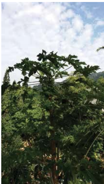
圖四 高大壯碩的木瓜樹，聳立雲霄

更盼望當選的人都能廉能，認真負責，不貪瀆，不舞弊，藍綠攜手合作，共創人民幸福，國家富庶。☩