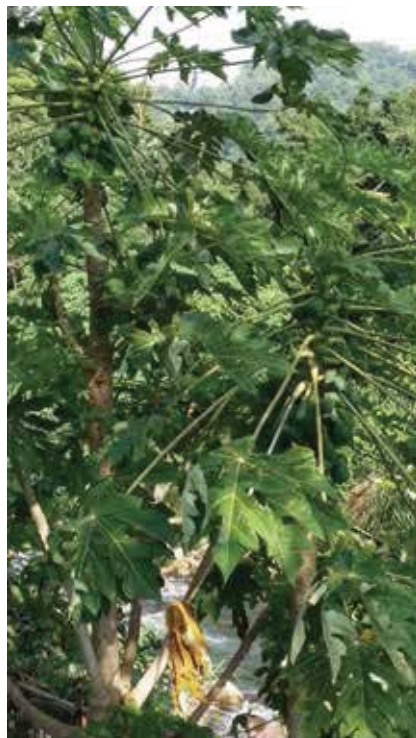
圖二 溪水邊的木瓜樹，結實磊磊