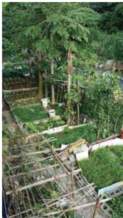
圖五 小菜圃鬱鬱蔥蔥，生氣盎然