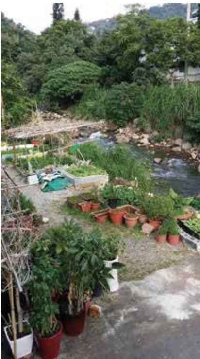
圖一 巨幅田園風情畫

大約走了十來分鐘，到達至善國中投票所。哇！被眼前的人龍驚嚇到！這地區人口並不密集，往年都不必排隊，今天恐怕要等很久了！