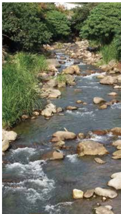
圖六 小溪彎彎，流水不斷來，溪裡的水草，充滿了活力